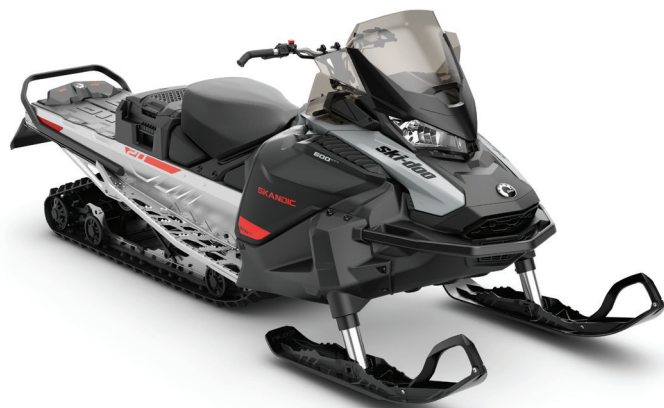
SKANDIC® SPORT 600 EFI