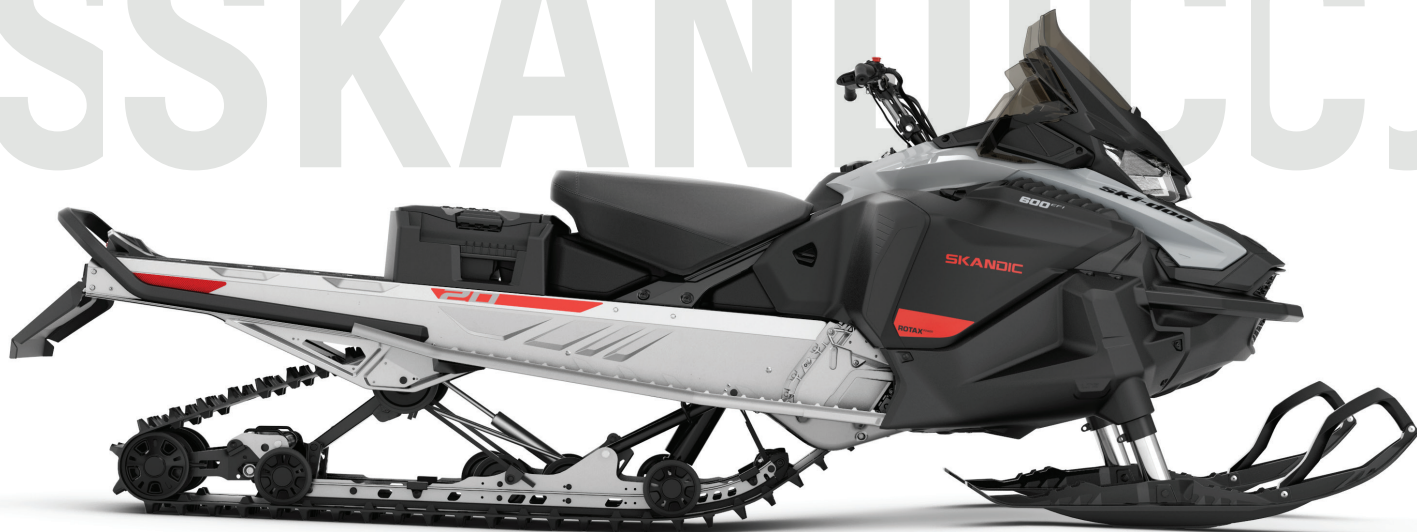
SKANDIC® SPORT 600 EFI