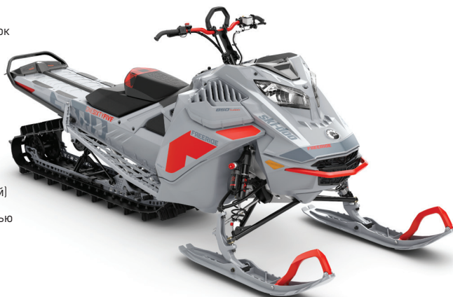
FREERIDE™ 165 850 E-TEC® TURBO