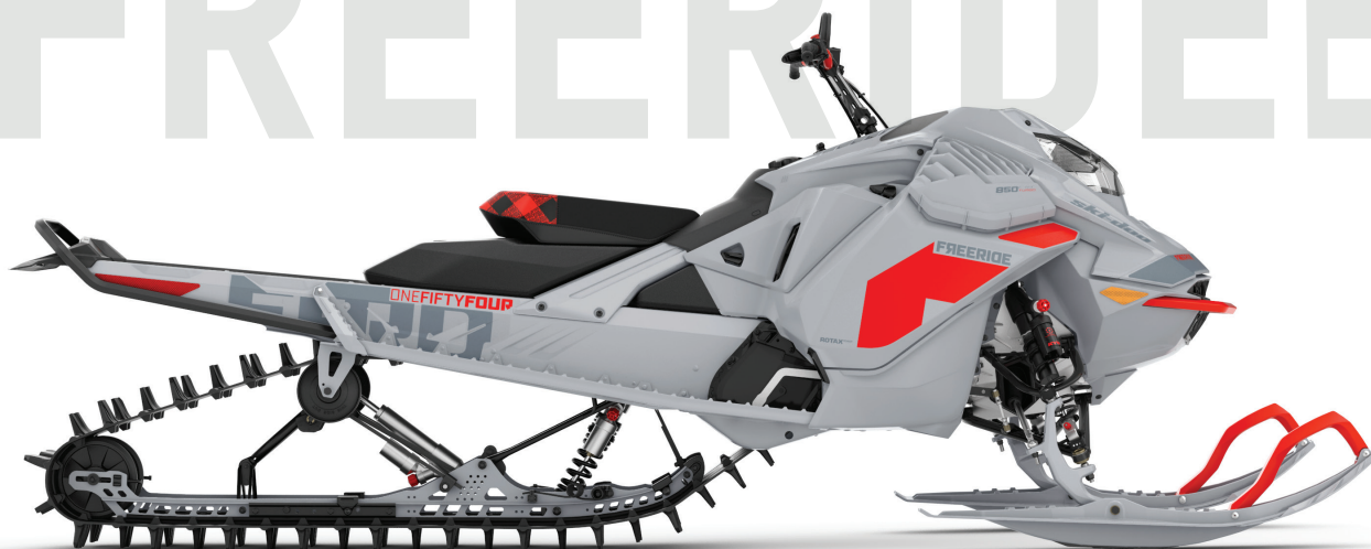
FREERIDE™ 154 850 E-TEC® TURBO